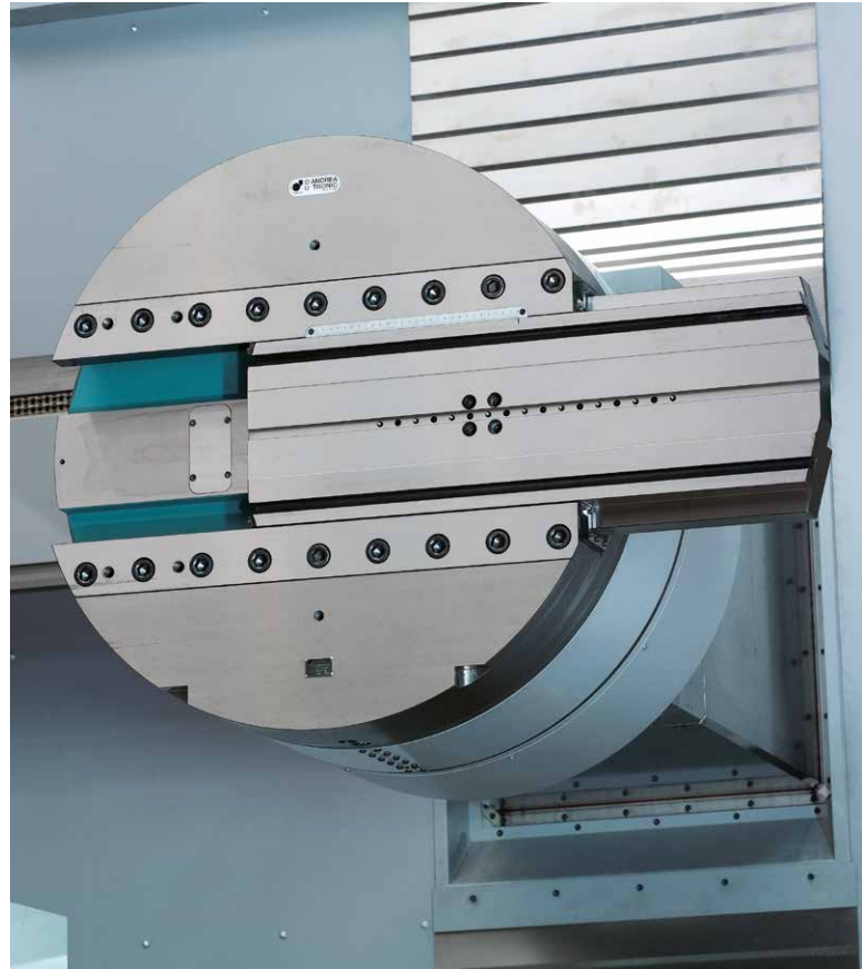
RAM mit angebautem Planschieber