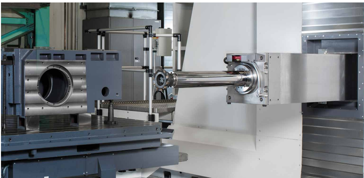
Weit ausfahrbarer RAM und Bohrspindel