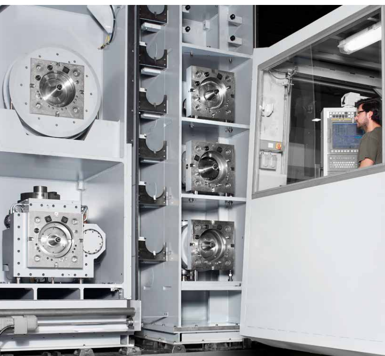
Pick-up-Station für mehrere Fräsköpfe und zusätzliche Ablageplätze für Sonderwerkzeuge