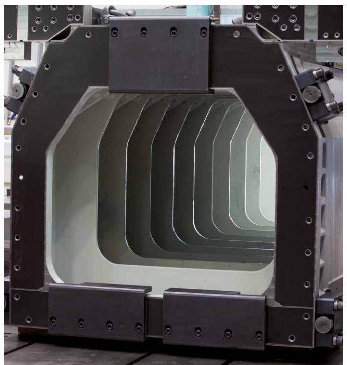
Robuster, stark verrippter Maschinenständer