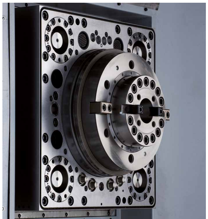
RAM mit automatischer Adapterplatte