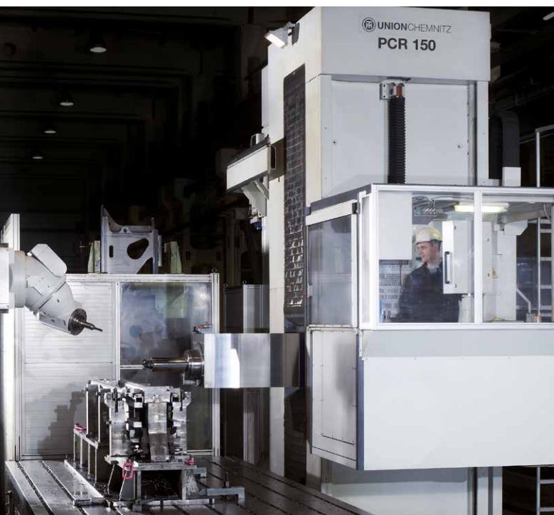
PR II 150 – vollhydrostatisch geführt