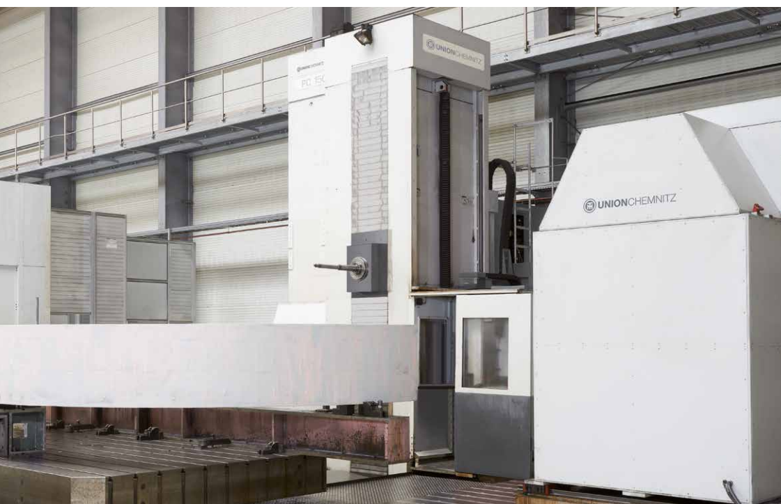
Bewährte Technologie für vielfältige Bearbeitungen