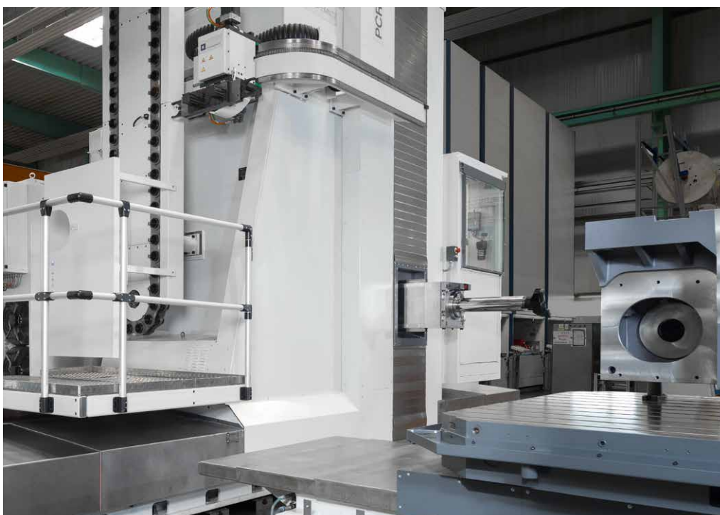
PR I mit kompakt geführtem Tragbalken und Bohrspindel für höchste Flexibilität