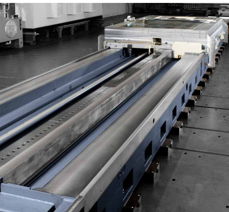
Hydrostatische Führungen des robusten Maschinenbetts